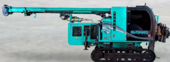
HÉLICE CONTÍNUA DE PEQUENO PORTE

CONHEÇA TAMBÉM OUTROS EQUIPAMENTOS DA LINHA EVOMAQ®