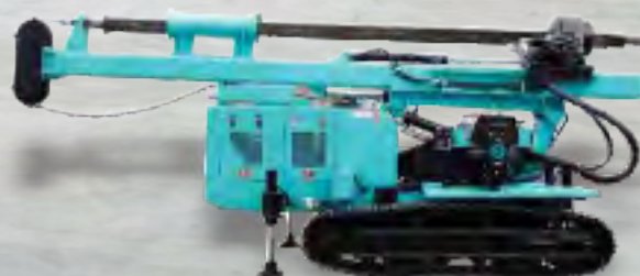
ESTACA ESCADA EVOMAQ®