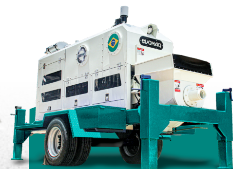
bomba de concreto rebocável evomaq ®