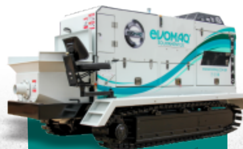
bomba de concreto sobre esteira evomaq ®