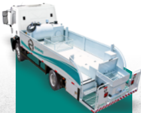
auto bomba de concreto evomaq ®

conheça também nossa linha de bombas de concreto