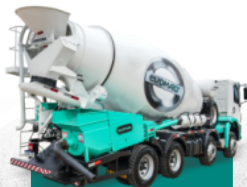
bt bomba de concreto evomaq ®