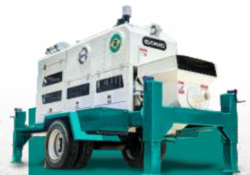
BOMBA DE HORMIGÓN ESTACIONARIA EVOMAQ ®