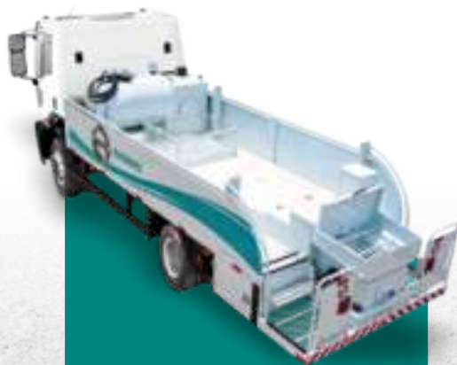
AUTO BOMBA DE HORMIGÓN EVOMAQ ®