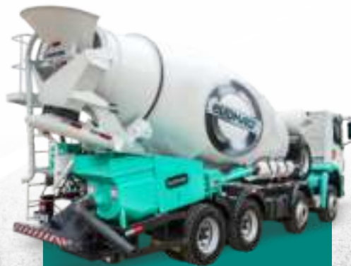
BETON BOMBA DE HORMIGÓN EVOMAQ ®