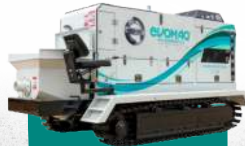
BOMBA DE HORMIGÓN SOBRE ORUGAS EVOMAQ ®